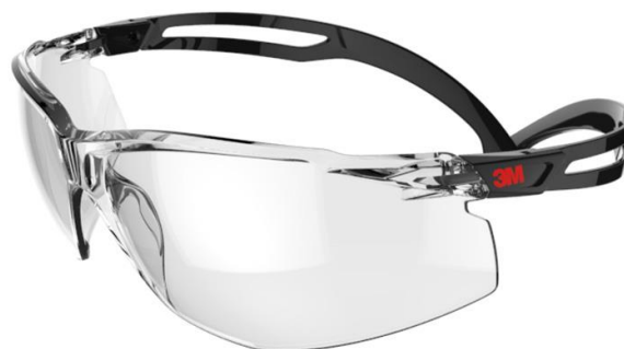
3M™ SecureFit™ 500