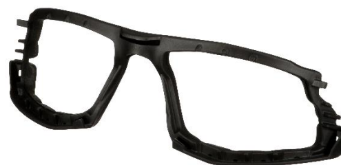
3M™ SecureFit™ Marco de espuma