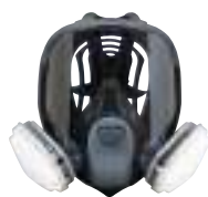
Respirador Purificador de aire

Las configuraciones del respirador Ultimate FX FF-400 incluyen: