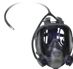
Respirador con suministro de aire dual

El respirador Ultimate FX FF-400 viene con accesorios innovadores que brindan comodidad y un mejor desempeño.