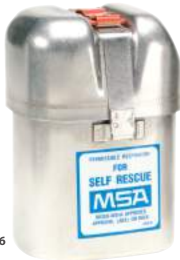
Autorrescatador W65 No. de parte 455696