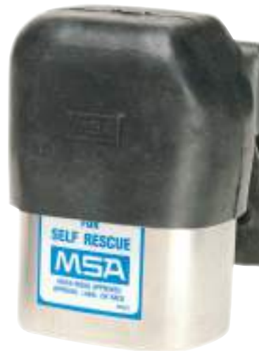
Bota protectora de hule negro para Autorrescatador W65